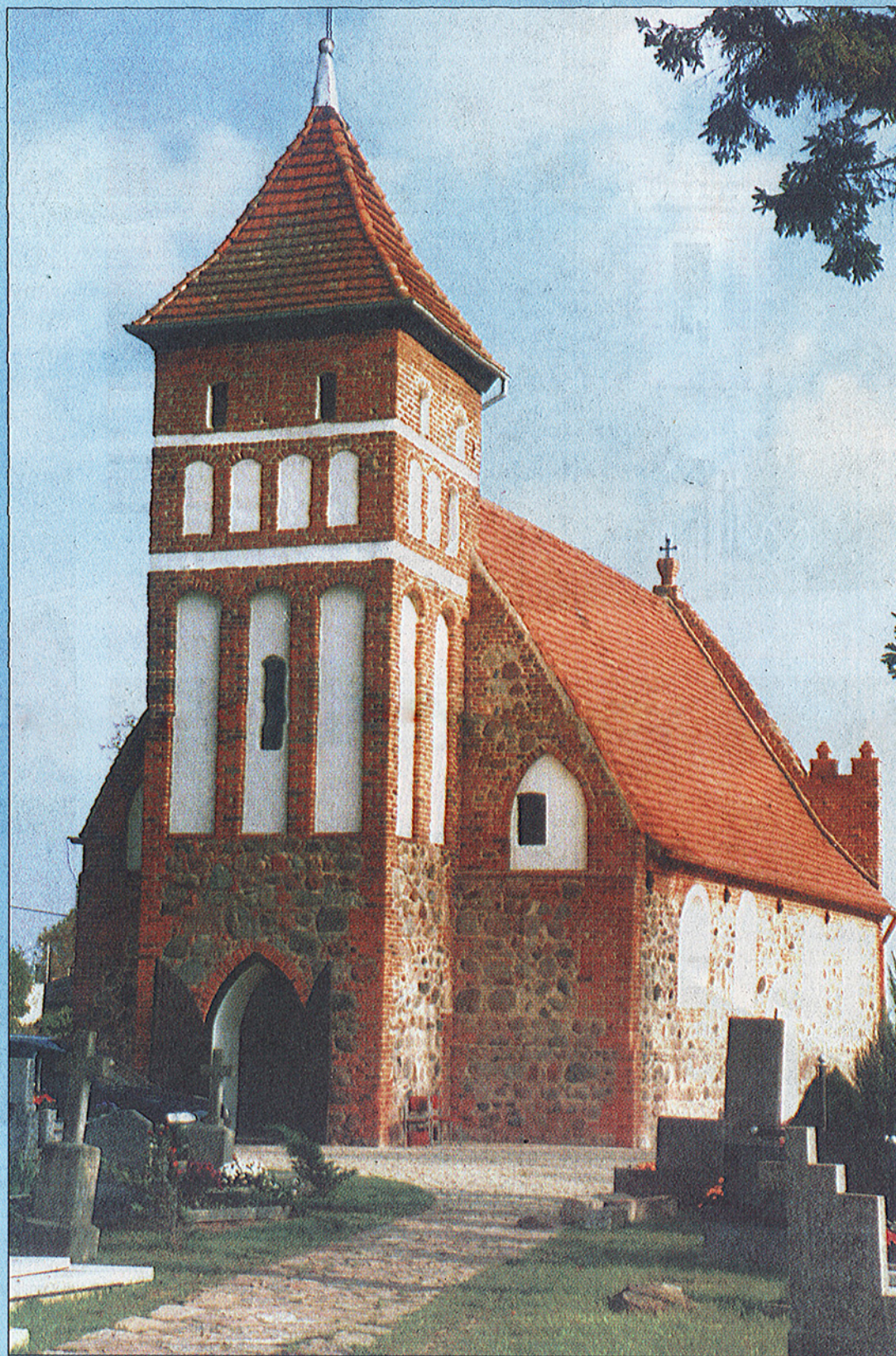
Kościół w Kiełbasinie